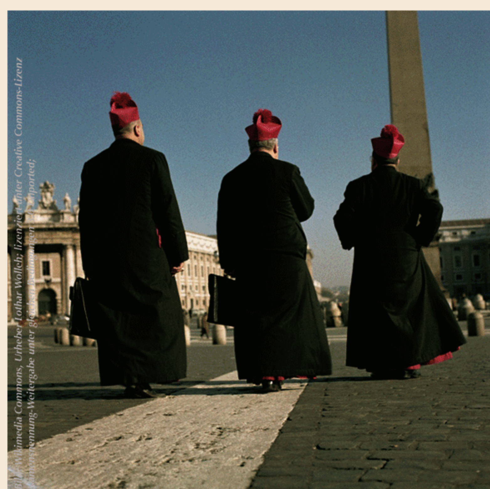
Programmänderungen zum jetzigen Zeitpunkt bleiben vorbehalten!

werden nur an studierende KVer erstattet: (0,10 Euro/Bahn-km, max. 30 Euro/Person)